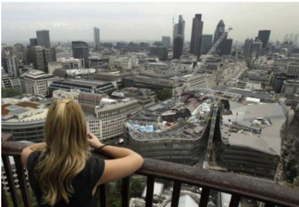
Pohľad na finančný dištrikt Londýna z výhľadovej galérie na katedrále Sv. Pavla(PA)

Prevzaté z internetu ( www.christiantoday.com ) Pripravil Dan Tomášik