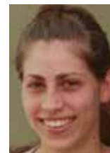
Pripravila Jana Zorjanová

Kristova duchovná cirkev aj tohto roku usporiadala kresťanské kempy na Oáze Elim na Fruškej Hore - pre deti, tínedžerov a mládež.